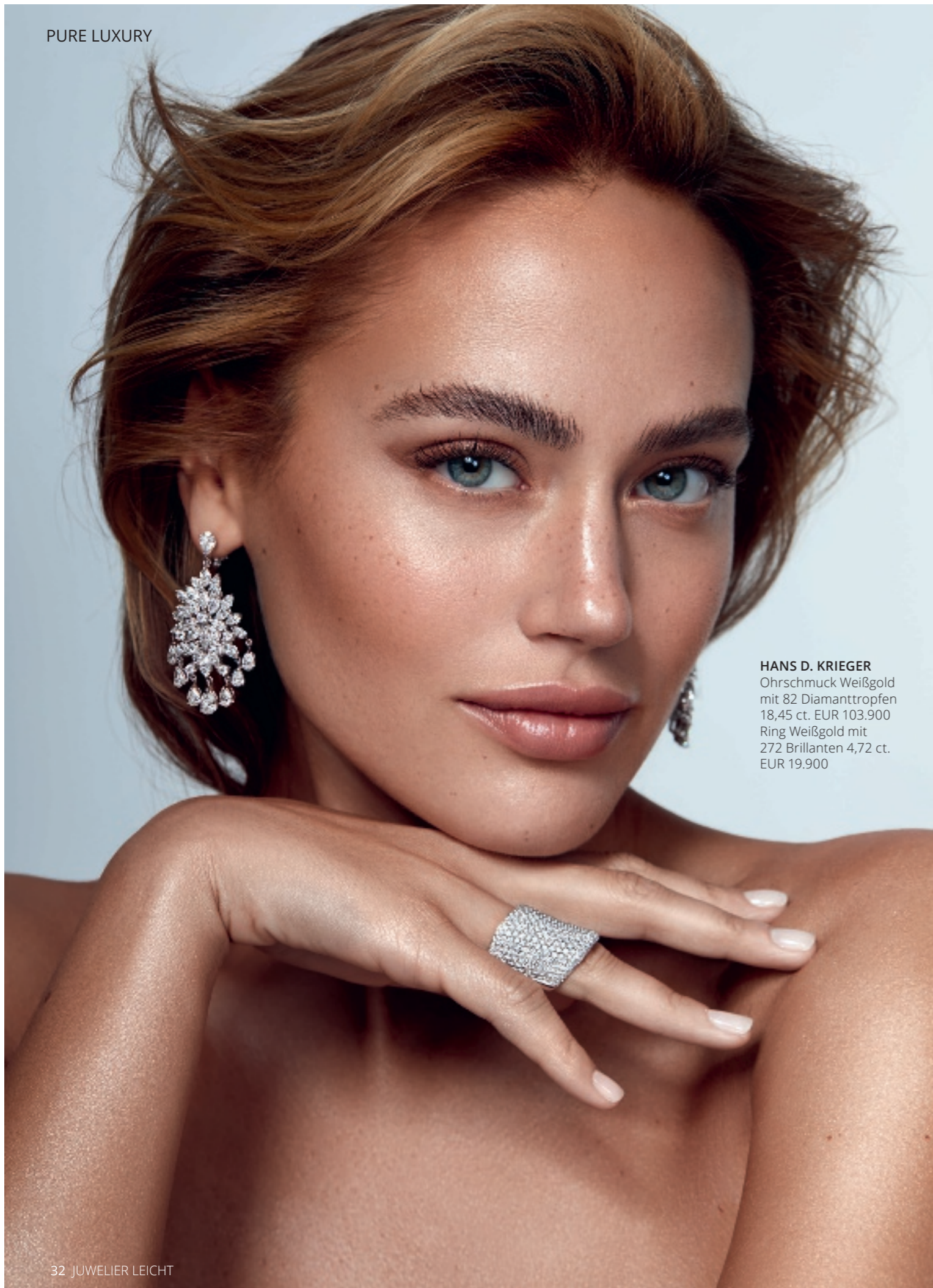
HANS D. KRIEGER Ohrschmuck Weißgold mit 82 Diamanttropfen 18,45 ct. EUR 103.900 Ring Weißgold mit 272 Brillanten 4,72 ct. EUR 19.900